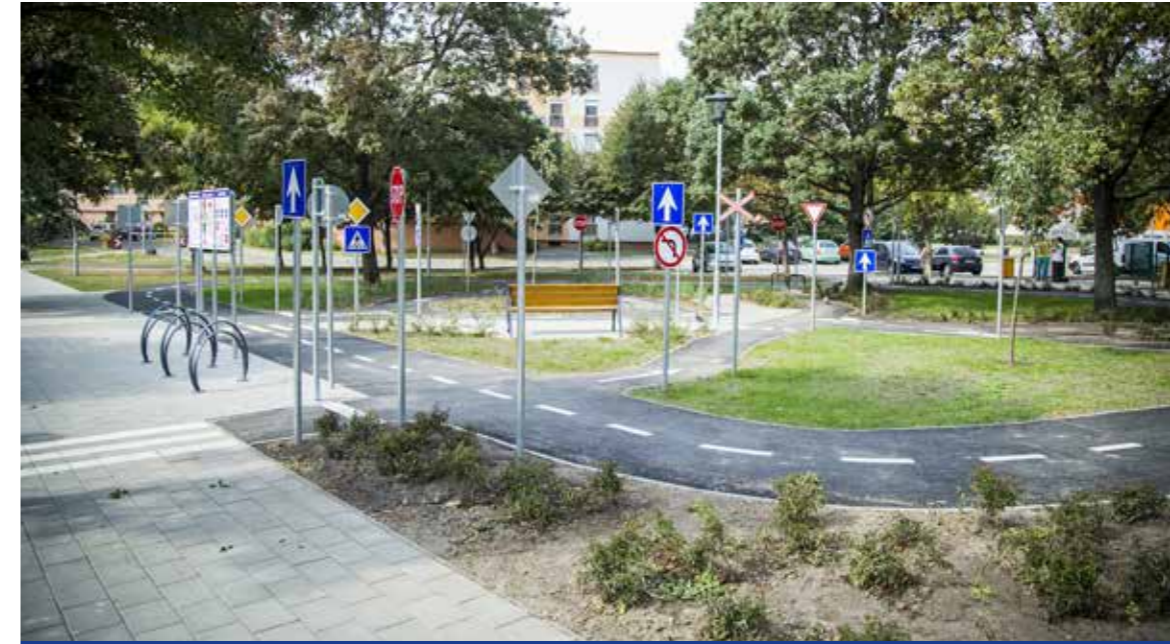
Négyezer négyzetméteres terület újult meg

Elkészült a kibővült funkciójú KRESZ-park a Kosárfonó utca – Vak Bottyán utca – Eötvös utca által határolt, csaknem 4000 négyzetméternyi területen, amelyet rövid ünnepség keretében adták át a kispesztieknek. Kétszázmillió forintból valósult meg a beruházás.