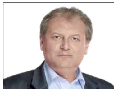
DR. HILLER ISTVÁN országgyűlési képviselő (MSZP)

Következő fogadóóráját 2019. október 10-én, csütörtökön 17 órától tartja a kispesti MSZP-irodában (XIX., Kossuth Lajos utca 50.). Előzetes bejelentkezés nem szükséges