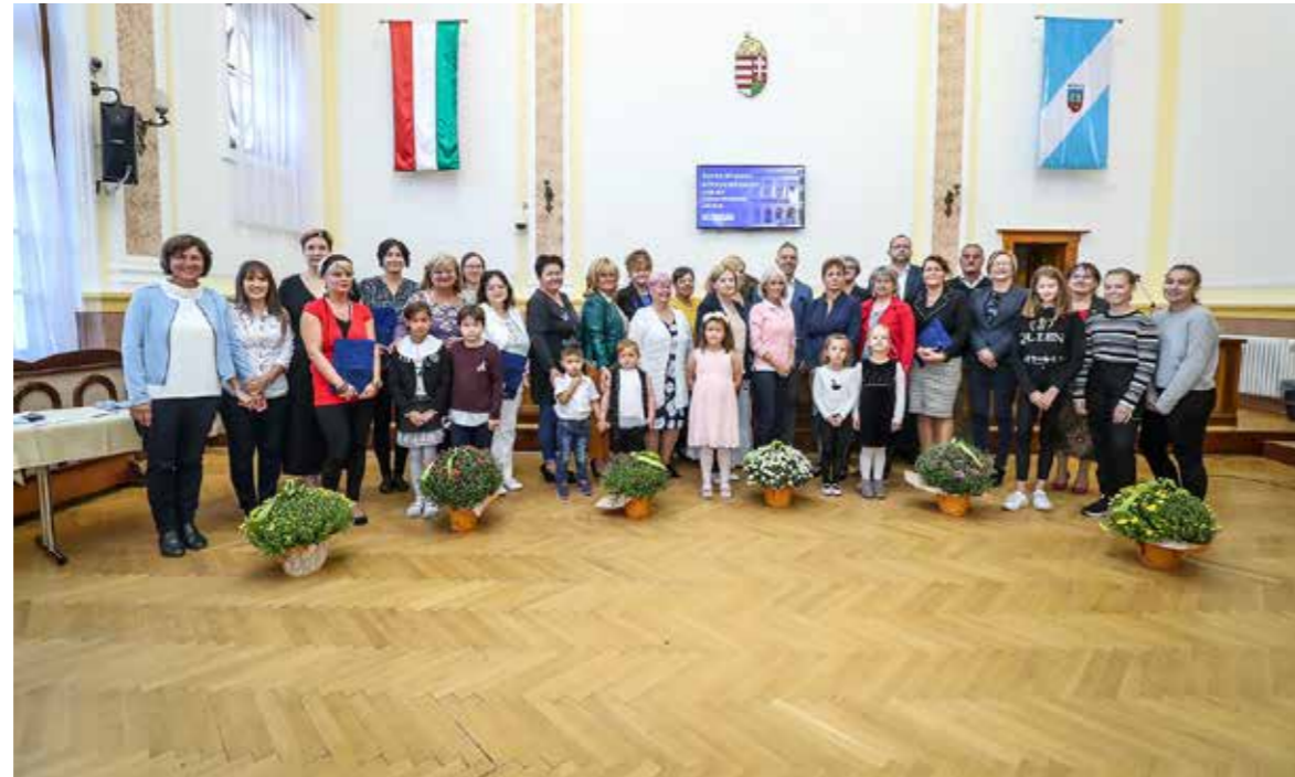
A Szébb Kispesti Környezetünkért pályázat idei díjazottjai

Az önkormányzat 21. alkalommal jutalmazta azokat a kispesti civilszervezeteket, közösségeket, intézményeket, amelyek programjai ösztönzik a legfiatalabb korosztályt a környezet ápolására, a meglévő természeti értékek megőrzésére.