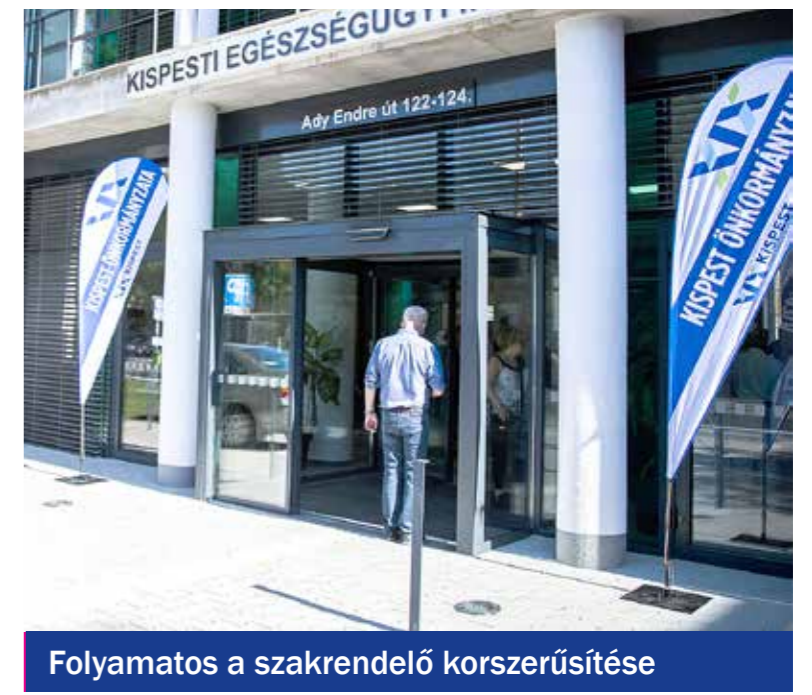
Folyamatos a szakrendelő korszerűsítése

Lakással és közösségi épülettel gyarapodott a Családok Átmeneti Otthona 2015-ben. Megújult a Segítő Kéz Kispesti Gondozó Szolgálat két egysége, az Őszirózsa Idősek Klubja és a Kertvárosi Idősek Klubja is. A tűzben megrongálódott Nyugdíjsház több tízmillió forintos kárelhárítása egyben az épület korszerűsítését is jelentette 2017-ben. Csaknem 9 millió forintot költött az önkormányzat a Magyar Vöröskereszt Ady Endre úti nappali melegedőjében lévő fürdőblokk felújítására. A Családok Átmeneti Otthonának 2018-ban megvalósult bővíté-