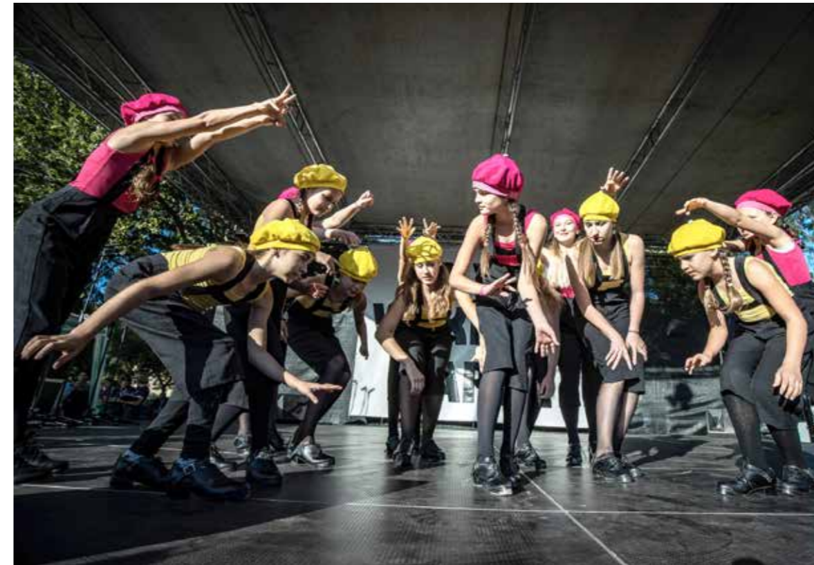
Egymást követték a látványos zenés, táncos produkciók

Huszonnyolcadik alkalommal rendezte meg Wekerletelep őszi fesztiválját az önkormányzat és más partnerek támogatásával, önkéntesek segítségével a Wekerlei Társaskör Egyesület.