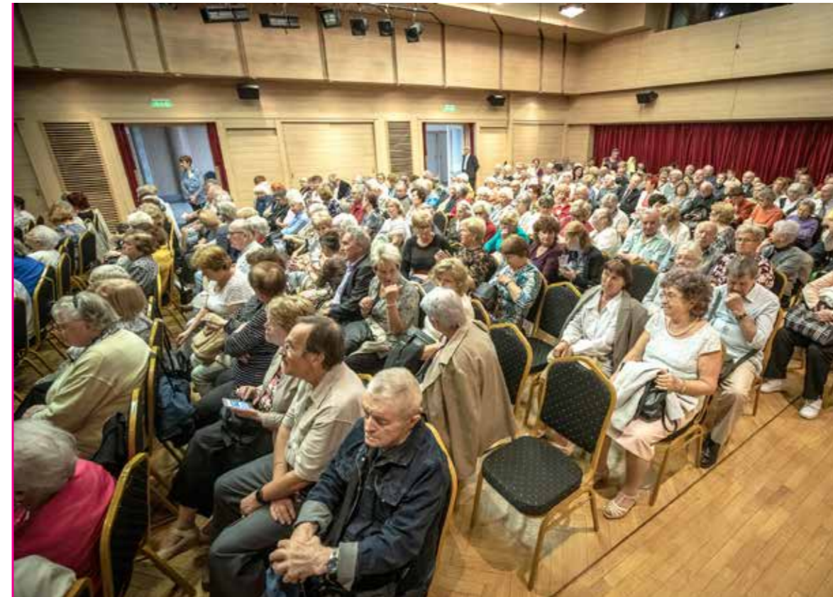
Ünnepi műsort rendeztek a KMO-ban a világnapon

Az idősek világnapján tizenegyedik alkalommal köszöntötte a kispesti időseket ünnepi műsorral az önkormányzat és a Segítő Kéz Kispesti Gondozó Szolgálat a KMO Művelődési Központban.