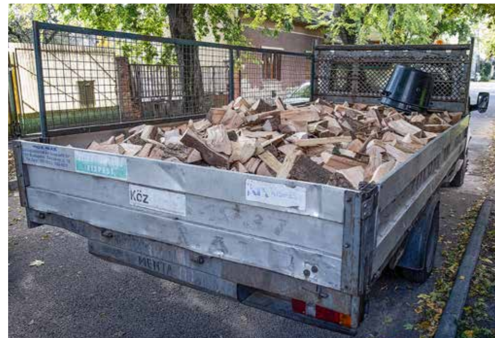
Háztartásonként 3,5 m 3 tűzifa jár a rászorulóknak