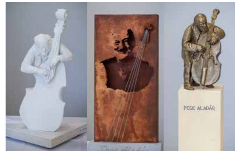
Közülük választ a testület

A képviselő-testület dönt arról, hogy a Pege Aladár emlékére kiírt szoborpályázatra beküldött tervek közül melyik valósulhat meg és ke-