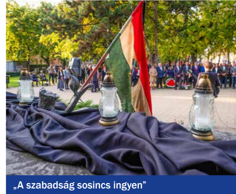
„A szabadság sosincs ingyen”