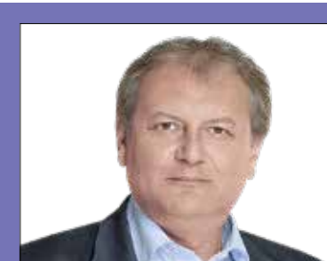
DR. HILLER ISTVÁN országgyűlési képviselő (MSZP)

2024. november 14., csütörtök 17.00 (XIX., Kossuth Lajos u. 50., MSZP-iroda)