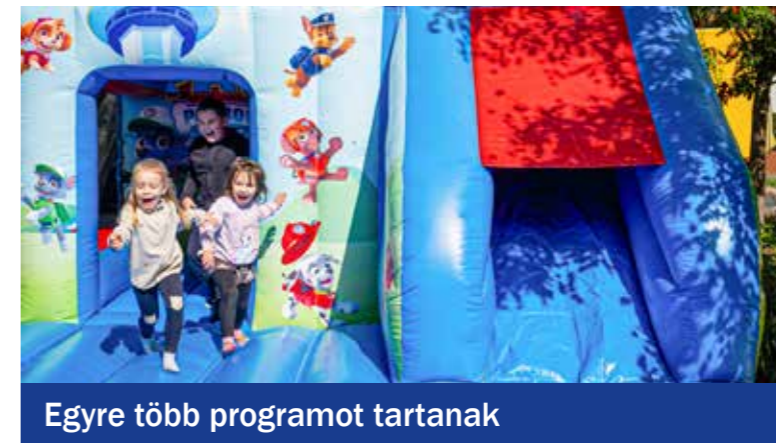
Egyre több programot tartanak

Ezúttal nem futással, hanem bográcsoszó-grillező-, valamint torta-, illetve süteménykészítő versenyekkel mozgatták meg a kertvárosiakat a szervezők. Négy csapat bográcsában rottyogott az étel, és még számtalan finomság várta a születésnapozókat. Rendeztek rajzversenyt egyesületi programok-élmények témában, a kicsik a felújított játszótér mellett kedvükre ugrálóvárazhattak, a nagyobbak 4D VR-szimulátorral próbálkozhattak, de volt darts, asztalifoci, pingpong és célba dobás is.