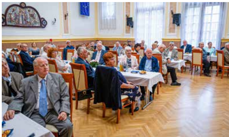
Két évtizedes hagyomány

Az 50 éve vagy annál régebben házasságot kötött párokat köszöntötték szeptember végén a Városházán.