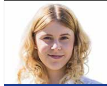
SZILAS KINC SŐ 8. sz. választókerület (MSZP-DK-Momentum-Párbeszéd-LMP)

Előzetes telefonos egyeztetés alapján (06-30-270-0012) minden hónap második csütörtökén 17 és 18 óra között.