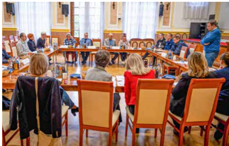
Sikeres volt a gyakorlat