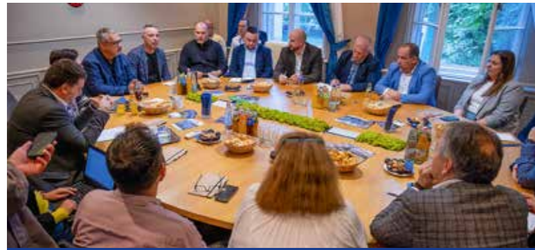
Együtt keresik a megoldást

A Kőbánya-Kispest csomópont helyzete volt a témája a Városházán október elején tartott munkamegbeszélésnek.