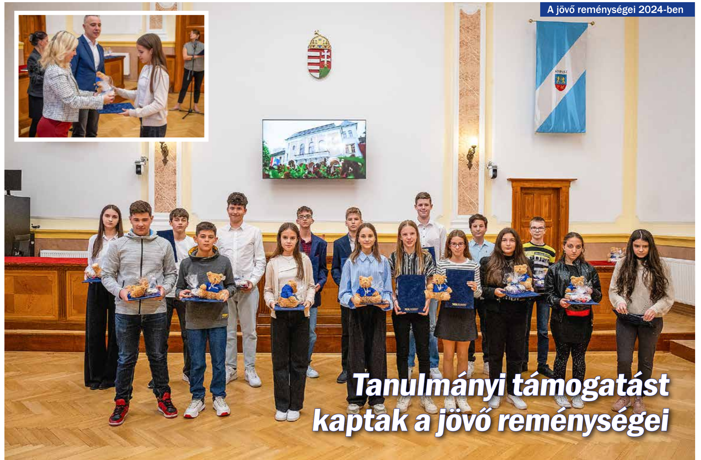
A jövő reménységei 2024-ben

Tanulmányi támogatást kaptak a jövő reménységei