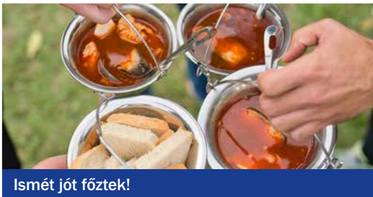
Ismét jót főztek!

Különdíjat kapott a Gasztro Devils By Gránit Ördögei (Gránit Kft.) réteges vaddisznópörköltje, a Dekiváló falatok (DK) káposztaágyon készített hús-gombócái, a Trió (Kispesti Román Nemzetiségi