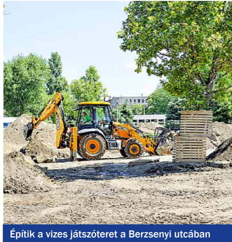
Építik a vizes játszótér a Berzsényi utcában

térően – ingyenes lesz, csakúgy, mint a parkolás, amelyen az önkormányzat mostanában nem is kíván változtatni – hangsúlyozta a polgármester. A kerületbejárás résztvevői azokat a tereket látogatták meg, amelyek az elmúlt időszakban készültek vagy újultak meg: a Központi játszótér, a Kós Károly teret, a Templom teret és az Ötvenhatosok teret, az Ady Endre úti foghíjtelken átmenetileg kiépített közparkot, a Határ úti Településkaput, a Dobó Katica és a Kazinczy Ferenc utca által határolt lakótelepet, az Eötvös iskola előtti teret, az Árnyas közösségi kertet, a Vásár tér első ütemében elkészült játszótérrel, valamint a Kossuth téri piac mögött épülő új közösségi teret és parkolót.