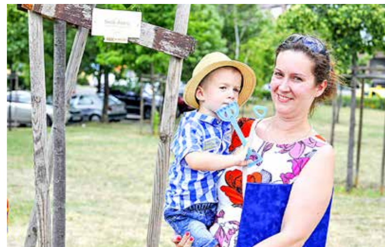
A kicsik is részt vesznek a környezetszépítésben

Tizenöt díszfát fogadtak örökbe szülők kisgyerekeiknek a Vak Bottyán utca 63. előtti közterületen, a Katica utca végénél. A „Te is fogadj örökbe egy fát gyermekednek!” program 2011-ben indult, célja, hogy még zöldebb és szebb legyen Kispest.