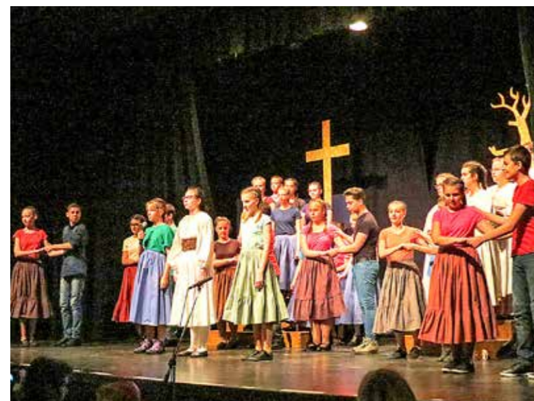
Különdíjas lett az Ady iskola diákjainak előadása