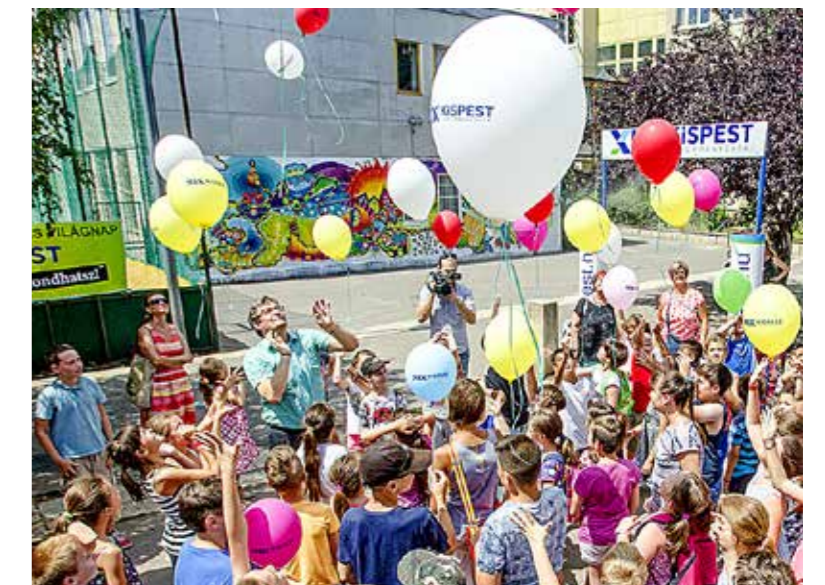
Kívánságlufik a magasban a kábítószer-ellenes világnapon