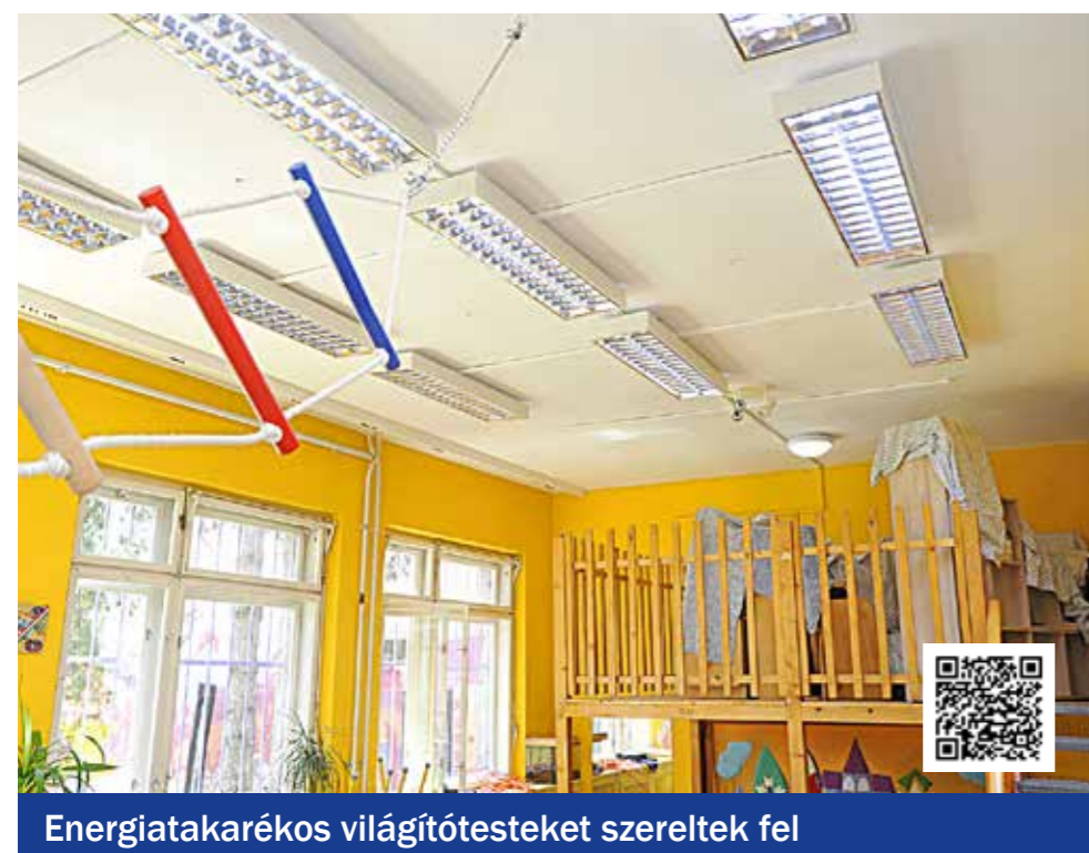
Energiatakarékos világítótesteket szereltek fel

szerűsítette az önkormányzat: a régi típusú armatúrák helyére kellemes fényt biztosító, energiatakarékos világítótesteket szereltek fel a folyosókon és a csoportszobákban, az öltözőkben, a vizesblokkokban, a kiszolgálóhelyiségekben és a külső részeken is. A