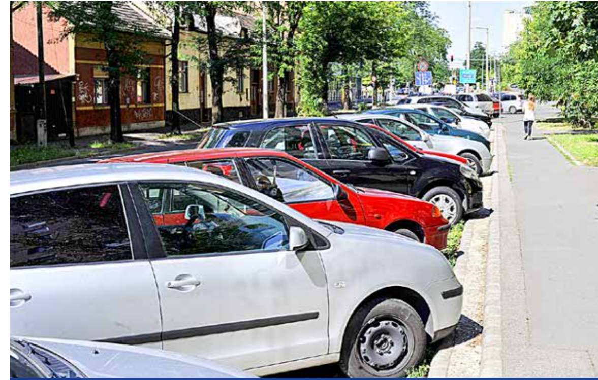
Legalizálják a parkolási szokásokat és új helyeket is kialakítanak

Parkolóépítési munkák kezdődnek a Kisfaludy utcában július második felében. A beruházás teljes költségét Kispest Önkormányzata finanszírozza.