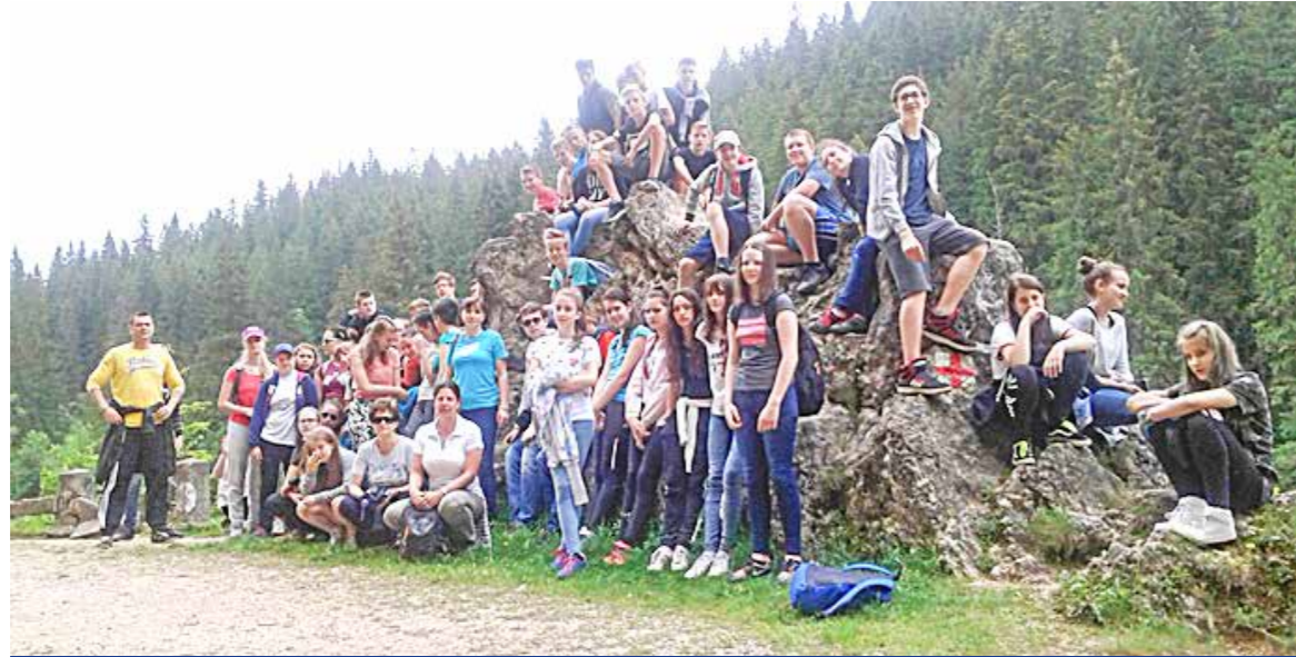
Ötnapos körutazáson vettek részt a Kós iskola diákjai

A Kispesti Kós Károly Általános Iskola két hetedikes osztálya csodálatos ötnapos erdélyi utazáson vett részt a „Határtalanul” program keretében.