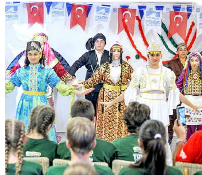
Nemzeti előadásokkal mutatkoztak be a fiatalok

Sikeresen zárult az idei testvérvárosi diákcsereprogram kispesti fejezete: több mint 80 szerbiai, bolgár, lengyel és török fiatal káptalanfüredi táborozása ért véget július közepén. Harminc kispesti gyerek az önkormányzat szociális táborában töltötte a vakációt, és ismerkedett a külföldi diákokkal.