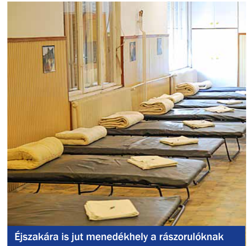
Éjszakára is jut menedékhely a rászorulóknak

kor az utcán gondozzák őket, és forró tea, takaró, konzerv, meleg ruha, gyógyszer mindig van az utcákat járó autóban. A Misszió Alapítvány Viola utcai menedékhelyén közel 60 embert látnak el, de az Iparos utca 1. szám alatti melegedőben is várják a rászorulókat. Vinczek