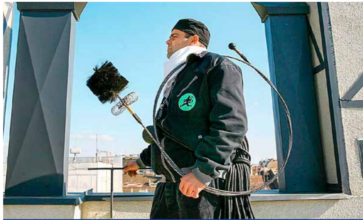
Továbbra is ingyenes marad a szolgáltatás

Az Országgyűlés döntése nyomán január elsejével megváltoztak a kéményseprés szabályai. A törvénymódosítás lényege, hogy az egy lakásos épületek tulajdonosai az általuk használt tüzelő-fűtőberendezés fajtájától függően évente vagy kétevente, továbbra is ingyenesen, a nekik megfelelő időpontban maguk igényelhetik a kéményseprőipari ellenőrzést.