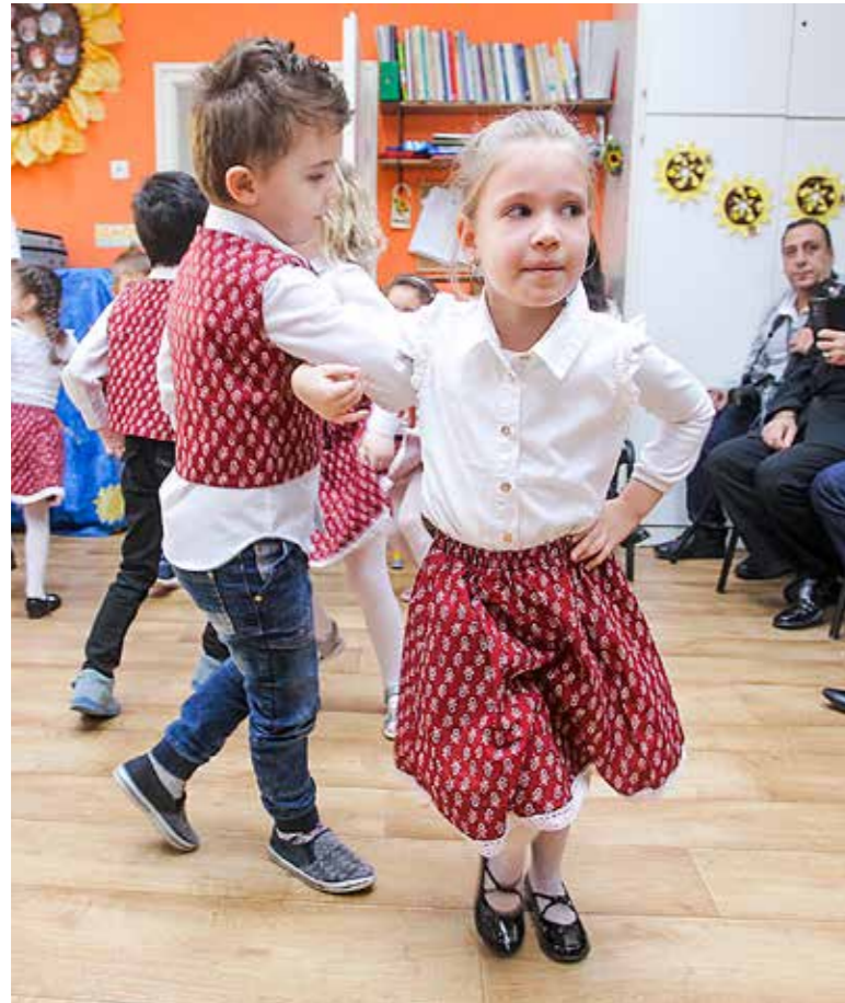
Az áprilisig tartó programsorozat megnyitóján

Egyedülálló, óvodásoknak szóló programmal bővült Kispest és Pendik testvérvárosi kapcsolata. Négy hónapon keresztül ismerkednek a török népi mondókákkal, dalokkal, mesékkel, táncokkal, gyermekjátékokkal és ízekkel a Szivárvány óvoda nagycsoportos óvodásai.