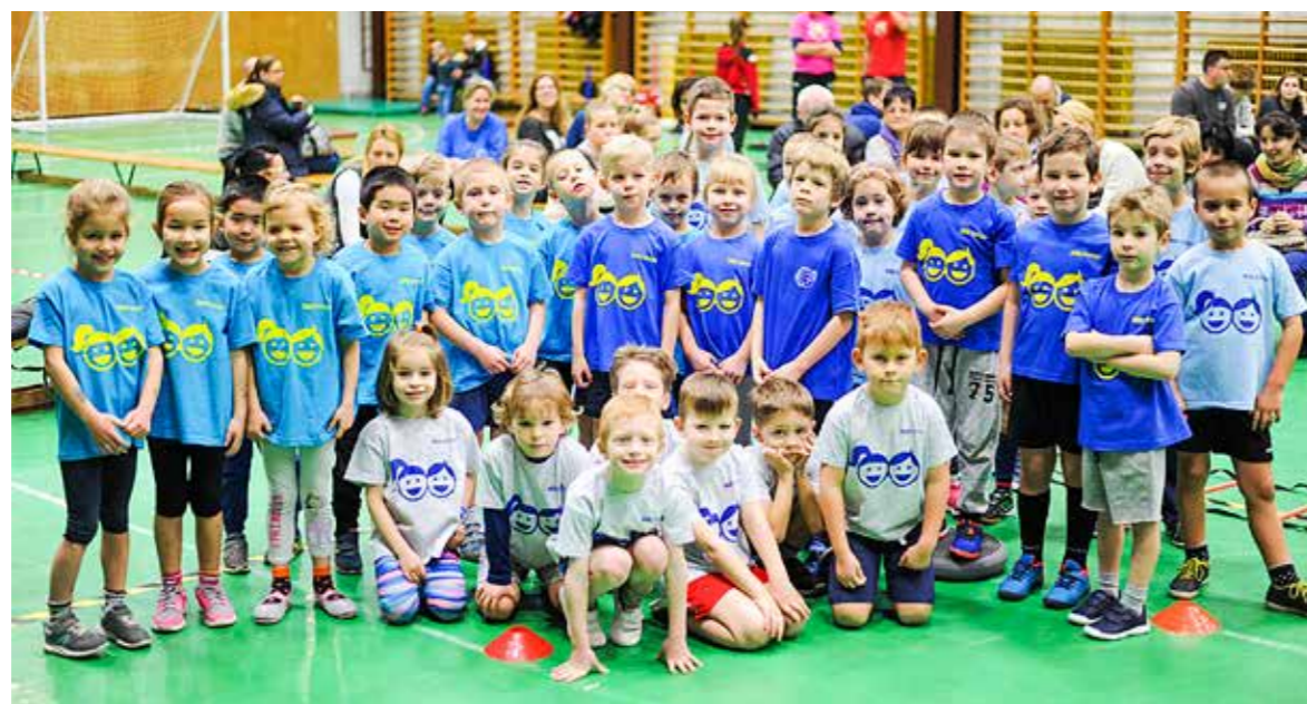
Játékos mozgást biztosítanak a foglalkozások

A Vass iskolában tartották a kerületi óvodás sportprogram második központi foglalkozását. A tavaszig tartó programot a Humánszolgáltatási és Szociális Iroda rendezi az utánpótlás-nevelő egyesületek és az óvodapedagógusok közreműködésével.