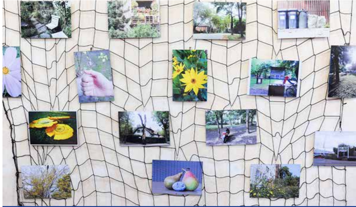
Egyre színvonalasabb munkák érkeznek a fiataloktól

A Városi ember és a környezet című fotópályázat anyagából nyílt kiállítás a Kispesti Városháza Tárlaton. A képeket február közepéig tekinthetik meg az érdeklődők.