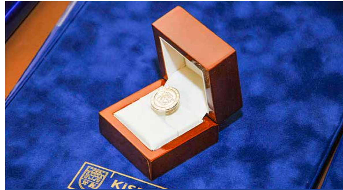
Február 20-ig várja a javaslatokat az önkormányzat

Budapest Főváros XIX. kerület Kispest Önkormányzat Képviselő-testületének 13/2015. (V.6.) önkormányzati rendelete alapján bármely kispesti lakos, valamint a kerületben székhellyel, telephellyel rendelkező civil szervezet javaslatot tehet Kispest Díszpolgára cím és Kispestért Díj adományozására.