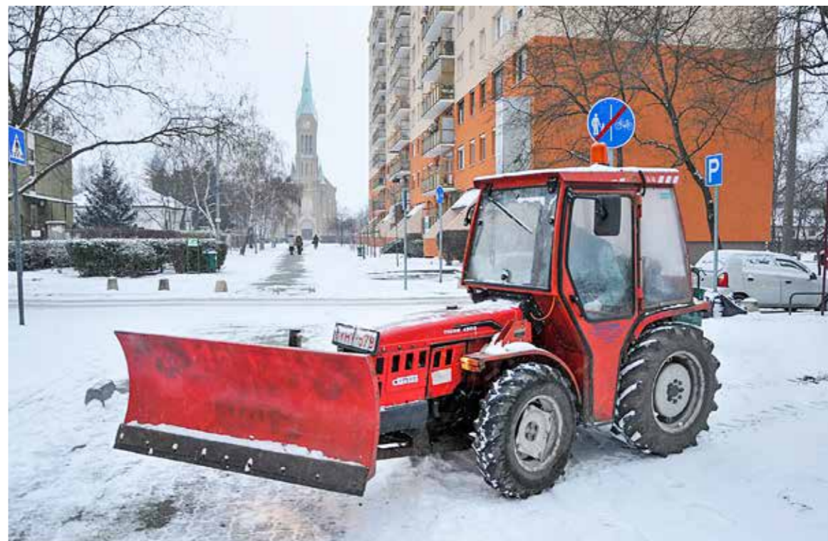
A közterületi járdákat a Közpark Kft. takarítja

Télen az utak és járdák a ráfagyott csapadék, illetve a letaposott hó miatt komoly veszélyforrást jelenthetnek a gyalogosan közlekedők számára. Ezért fontos, hogy hó- és jégmentesítésükről a feladat kötelezettjei gondoskodjanak.