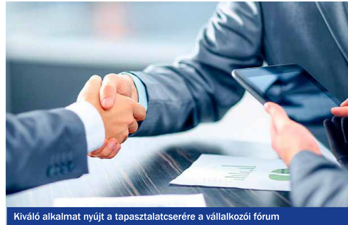
Kiváló alkalmat nyújt a tapasztalatcsere a vállalkozói fórum

„Mi fán terem a stratégia? – Első lépések a siker felé” címmel a IV. Kispesti Üzleti Találkozót rendezi Kispest Önkormányzata és a KMO Művelődési Ház 2018. március 23-án, pénteken 10 és 14 óra között a Kispesten és környékén élő és tevékenykedő vállalkozók, intézményekben dolgozók részére.