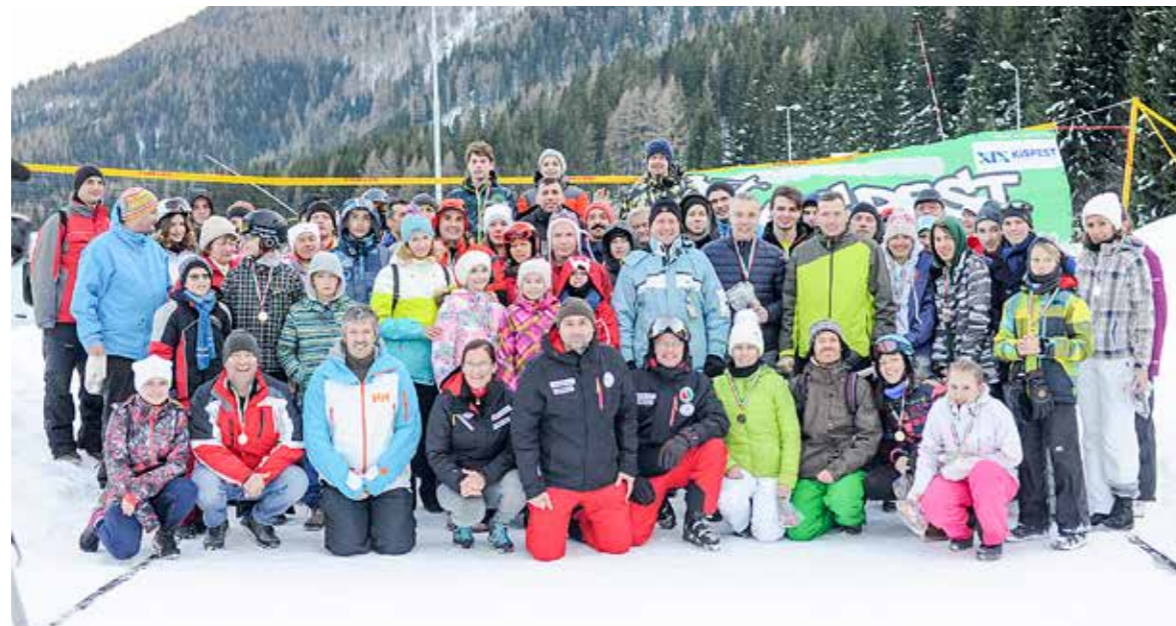
A VII. Kispesti Winter Fun résztvevői

A VII. Kispesti Winter Fun ifjúsági és felnőtt síversenyt az ausztriai Präbichlben rendezte meg az önkormányzat.