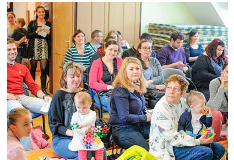
Sokan gyermekeikkel együtt érkeztek

el a gyermekek felügyeletét 6 hónapostól 3 éves korig. A gyermekfelvétel minden hónap második szerdáján 9–15 óra között a Csillagfény bölcsődében (1191 Bp., Eötvös utca 11.) történik. Az intézményvezető tájékoztatóját követően a részlegvezetők mutatták be az egyes bölcsődéket, majd az érdeklődő szülők kérdéseit válaszolták meg. Sokan gyermekeikkel együtt érkeztek, akikkel a kötetlen beszélgetés ideje alatt a játszószőnyegen tölthették el az időt. A kispesti bölcsődékkel kapcsolatos tudnivalók a www.kispest.hu honlapon olvashatók.