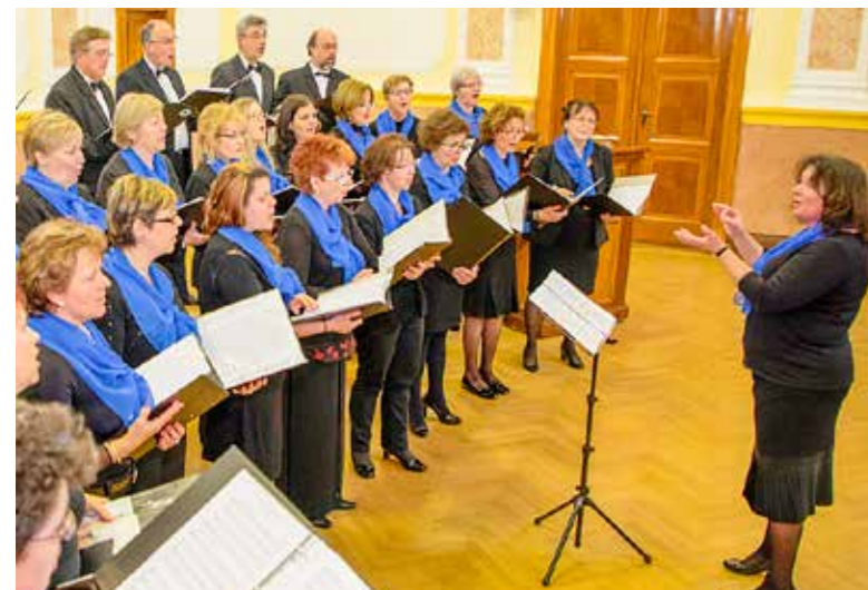
Idén a Gyöngyvirág kórus kapott elismerést

Kiemelkedő közművelődési tevékenységéért a Kispesti Vegyeskar – „Gyöngyvirág” kórus kapott elismerést a magyar kultúra napja alkalmából rendezett ünnepségen a Városházán.