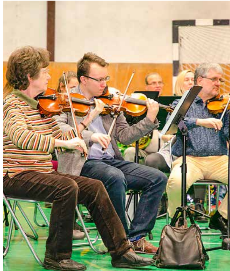
Farsangi délutánt rendeztek a Vass iskolában

mogató” segítette az ismerkedést a zenekar hangszereivel, majd estig tartó táncház következett, amelyen az iskola néptáncosai is bemutatkoztak. Az ünnepsorozat tavaly decemberben két koncert nyitotta: a szimfonikusok, majd a fúvósok adtak hangversenyt az evangélikus templomban. A farsangi program folytatásaként a fúvószenekar lépett fel a Városháza dísztermében. Tavasszal a tagozatok tartanak koncerteket az intézményben, április 23-24-én hangszer- és táncbemutatót rendeznek, április 26-27-én pedig a felvételik lesznek. Június első hetében több hangversenyt is tartanak a Városházán: fellép a szimfonikus zenekar, a fúvószenekar, tanárok, növendékek és egykori növendékek adnak koncerteket. Október 1-jére, a zene világnapjára nagyszabású hangversennyel készülnek. Az ünnepi évet karácsonyi koncert zárja majd az evangélikus templomban.