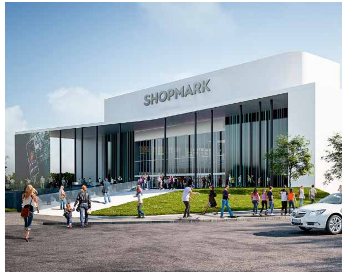
Kívül-belül látványos változásokat ígérnek

A külső kivitelezési munkálatokkal megkezdődött a Shopmark renoválása. A meghívásos, háromfordulós tender eredményeként a KÉSZ Építő Zrt. végzi a bevásárlóközpont átépítését. A külső felújítási periódus alatt, április 22-ig az épület látogatható marad a vásárlók számára.