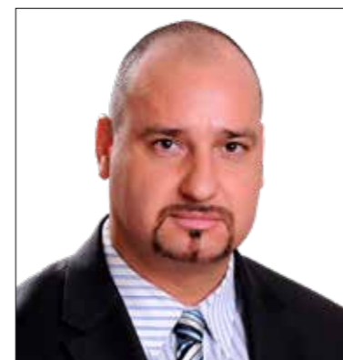
Lázár Tamás (Jobbik)

lők áldozatait, az önkormányzat tűzoltása nem pótolhatja ezt. Közismert gondot jelent a pedagógusok és a technikai munkatársak leterheltsége, magára hagyottsága, alulfizetettsége és motivációvesztése is. A kerületi iskolai körzetekből kivont egyházi iskolák kivételzettsége elősegíti az eltérő képességű és háttérű gyerekek szegregációját, tovább súlyosbítva az állami iskolákban dolgozók és tanulók helyzetét. Az önkormányzat a csekély, tűzoltásszerű segítségen túl megteheti, hogy a tankerületen keresztül folyamatosan nyomást gyakorol a kormányzatra, hogy a közoktatás mostoha helyzete érdemben változzon. Addig is pedig meg kell teremteni vagy erősíteni a helyi oktatásban dolgozók jutalmazásának és terheik csökkentésének önkormányzati eszközeit.