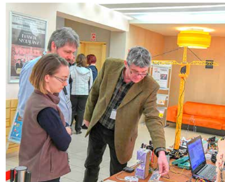
Ki is lehetett próbálni a bemutatott eszközöket

A jelen számítástechnikai eszközeinek, programjainak, az okostelefonok, tabletek, robotok iskolai, oktatási alkalmazásának lehetőségeiről immár második alkalommal tartottak konferenciát és szakmai bemutatókat a Puskás iskola szervezésében a KMO-ban.