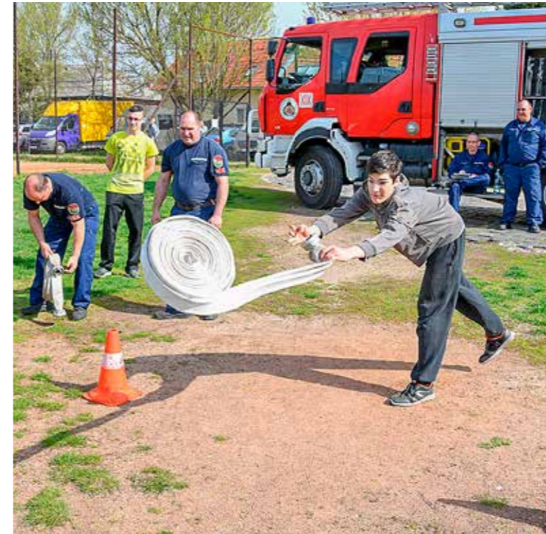
Ügyességi feladat az egyik gyakorlati állomáson

Az általános iskolás csapatok közül a Kós iskola „Mancs őrzárata”, a középiskolások mezőnyében a Deák gimnázium diákjaiból álló „The Legends” nyerte meg a KAC-pályán rendezett kerületi katasztrófavédelmi versenyt.