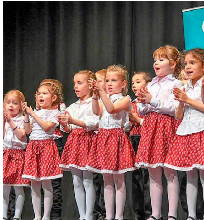
A Szivárvány óvodásai a program záróünnepségen

Befejeződött a Yunus Emre Török Kulturális Intézet és a Kispesti Szivárvány Óvoda idén januárban indult török–magyar kulturális programsorozata. A záróünnepségre a pendiki Puskás-szobor és Török–Magyar Barátság Park avatásának első évfordulója alkalmából került sor a KMO-ban.