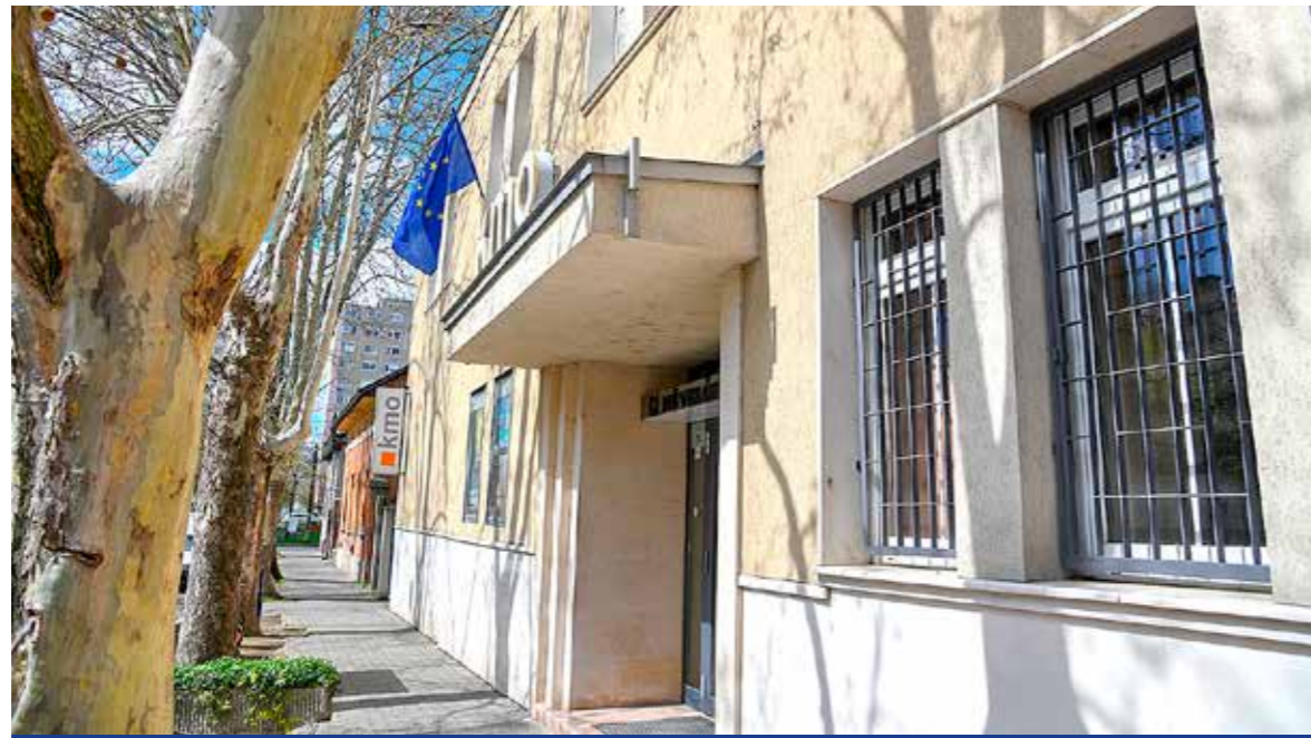
Közel száz éve Kispeszt kulturális életének meghatározó szereplője

Nagyszabású ünnepi programsorozatot szervez a KMO Művelődési Ház 95. születésnapja alkalmából május 7-13. között. Egész héten különleges események színesítik a rendezvénysorozatot: lesz kiállítás, konferencia, családi program, helytörténeti séta, színházi előadás, zenekari találkozó, zenés-táncos est, és nem maradhat el – neves fellépők közreműködésével – a születésnap gálaműsor sem.