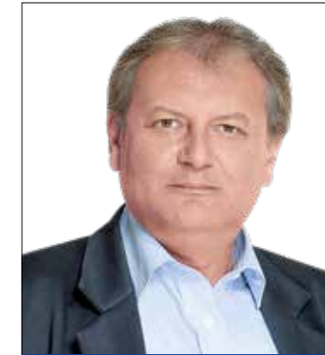
Dr. Hiller István (MSZP)

1982–87 között esti tagozaton elvégezte a Marx Károly Közgazdaságtudományi Egyetem Ipari Karán a tervező-szervező szakot. 1991 és 1992 között elvégezte a Századvég Politikai Iskolát. Az 1994. évi országgyűlési választásokon Budapest 28. számú (Kiszepes) választókerületében, a második fordulóban 49 százalékos támogatással szerzett mandátumot. Az 1998. évi országgyűlési választásokon ismét Kiszepesben indult, és nyert. 2002-ben harmadszor is megszerezte az egyéni győzelmet. 2002. május 27-től 2003. március 2-ig a Pénzügyminisztérium politikai államtitkára volt, 2003–2004 között foglalkoztatáspolitikai és munkügyi miniszter. 2006-ban ismét egyéni mandátumot szerzett Kiszepesben. 2007 januárjától a Miniszterelnöki Hivatal gazdaság- és közlekedésfejlesztésért felelős államtitkára, 2008 nyarától a Nemzeti Fejlesztési és Gazdasági Minisztérium államtitkára volt. A 2010-es országgyűlési választásokon a budapesti területi listán szerzett mandátumot. 2014-ben a 9. választókerületben (Kiszepes–Kőbánya) jutott be a parlamentbe.