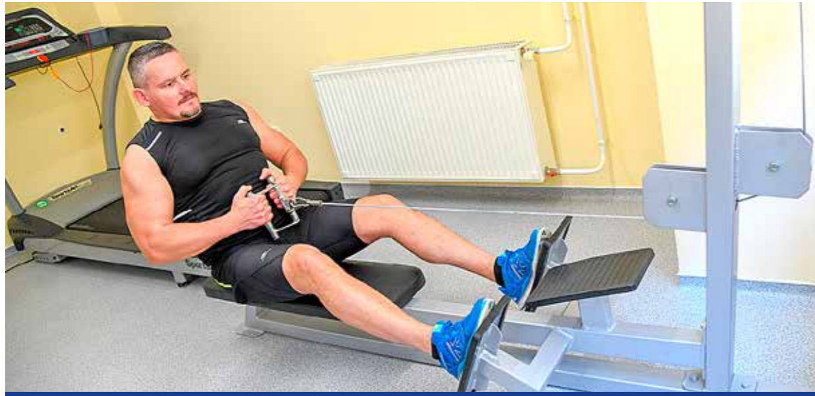
Elengedhetetlen a megfelelő kondíció megőrzése

Önkormányzati támogatásból alakított ki konditermet a Kispest Közbiztonságáért Alapítvány a kerületi rendőrkapitányságon.