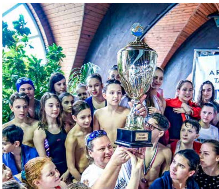
Harmadszor emelhették magasba a kupát