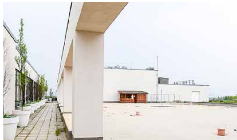
Részen beépítik a tetőkeretet is