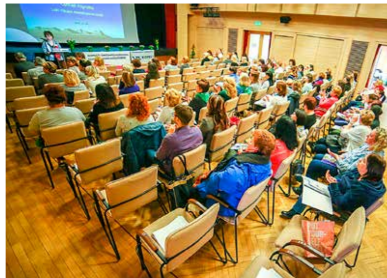
Harmadszor rendeztek óvodapedagógiai napokat