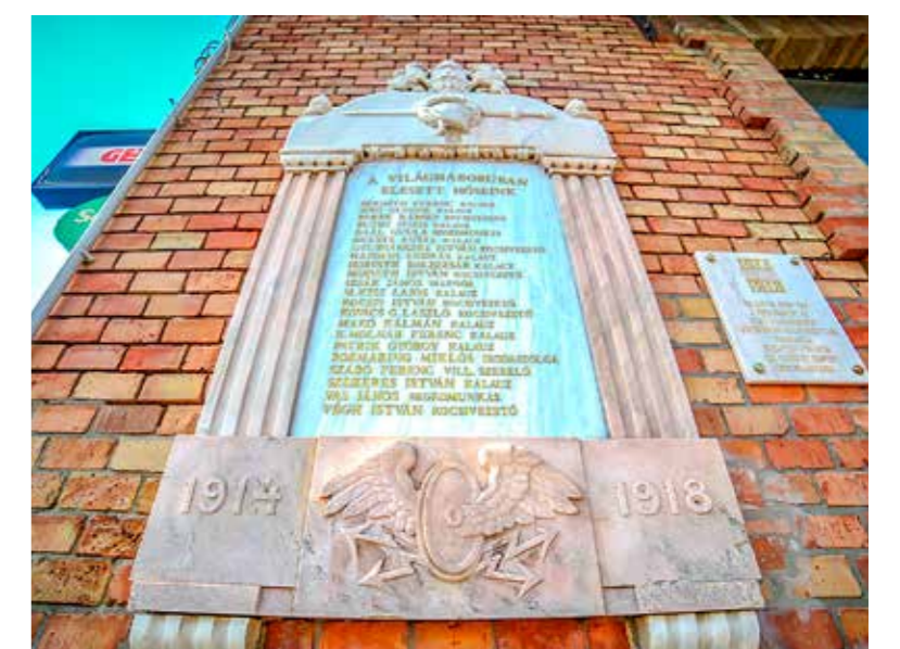
Huszonkét kispesti dolgozó emlékét őrzi a tábla