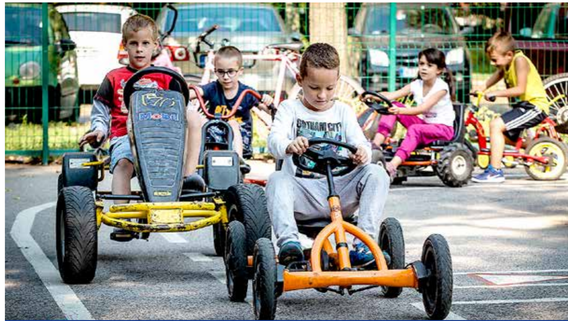
Játékos programok várták a gyerekeket

Új helyszínen, a József Attila utca és a Hunyadi utca sarkán lévő mini KRESZ-parkban tartotta az idei autómentes nap kerületi rendezvényét az önkormányzat. Négy-négy óvodából és iskolából csaknem háromszázan vettek részt a programon.