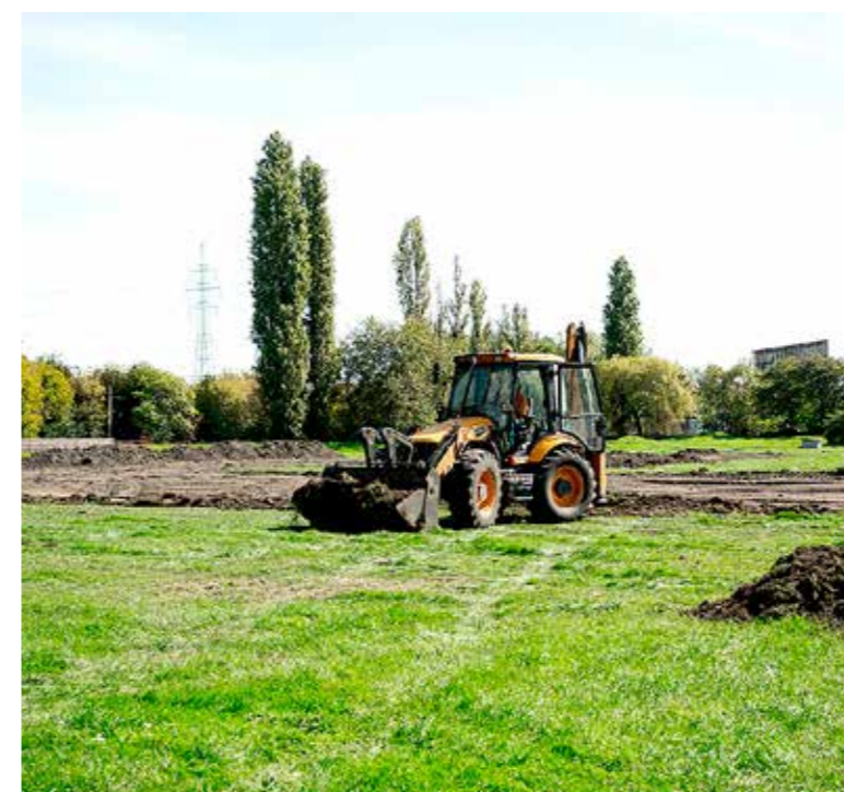
Műfüves focipályát és futókört alakítanak ki

Elindult a Katona József utcai Önkormányzati Sporttelep, a KAC-pálya felújítása. A beruházást a Magyar Labdarúgó Szövetség (MLSZ) finanszírozza, bruttó költsége 220 millió forint. Az MLSZ-szel kötött együttműködési megállapodás