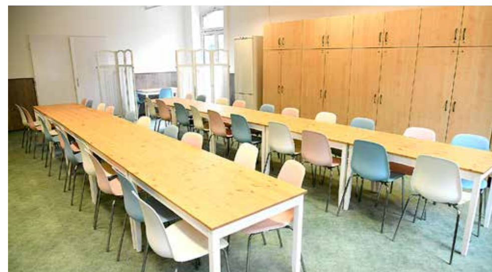
Tiszta, rendezett környezetben ebédelhetnek a gyerekek