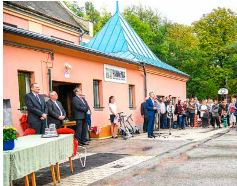
Kispesten négyszáz kisdíák kezdte az első osztályt

Hamarosan birtokba vehetik az elkészült új tantermeket a Pannónia Általános Iskola tanulói: tanévkezdetre elkészült a tetőtér-bővítés. A kerületi tanévnyitó az olykor szemerkélő esőben az iskola énekkarának és színjátszó csoportjának műsorával, valamint az elsősök szavalataival kezdődött.