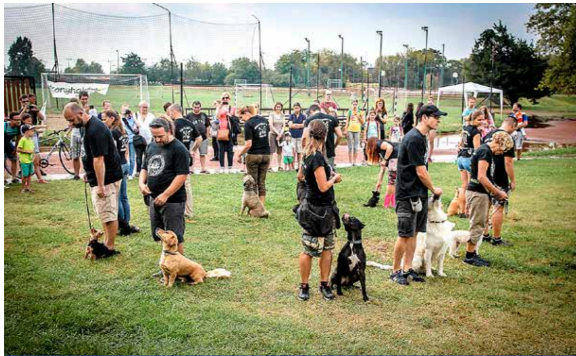
Kutyás bemutatók is színesítették a programot