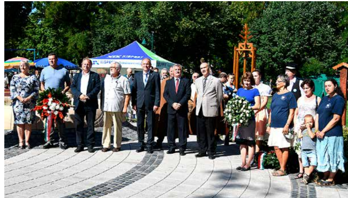
Koszorúzás Wekerle Sándor szobránál a Kós Károly téren

Huszonhetedik alkalommal rendezte meg Wekerletelep őszi kulturális fesztiválját az önkormányzat és más partnerek támogatásával, önkéntesek segítségével a Wekerlei Társaskör Egyesület szeptember harmadik hétfőjén.