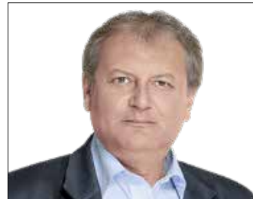
DR. HILLER ISTVÁN országgyűlési képviselő (MSZP)

Következő fogadóóráját februárban tartja a kispesti MSZP-irodában (XIX., Kossuth Lajos utca 50.). Előzetes bejelentkezés nem szükséges