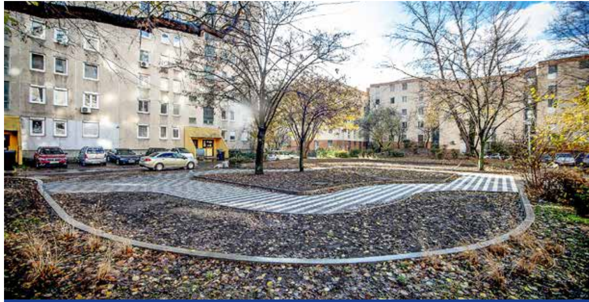
Több ütemben alakítják ki a pihenőparkokat

Pihenőparkokat alakítanak ki több ütemben az Árpád utca és a Nagysándor József utca között, valamint a Toldy utca és a Széchenyi utca között. Az önkormányzat a kispesti Zöldprogram keretében jövőre is folytatja a lakótelepi parkok megújítását.