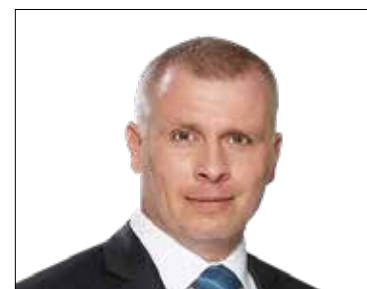
FEKETE MÁRK Listás képviselő (Fidesz-KDNP)