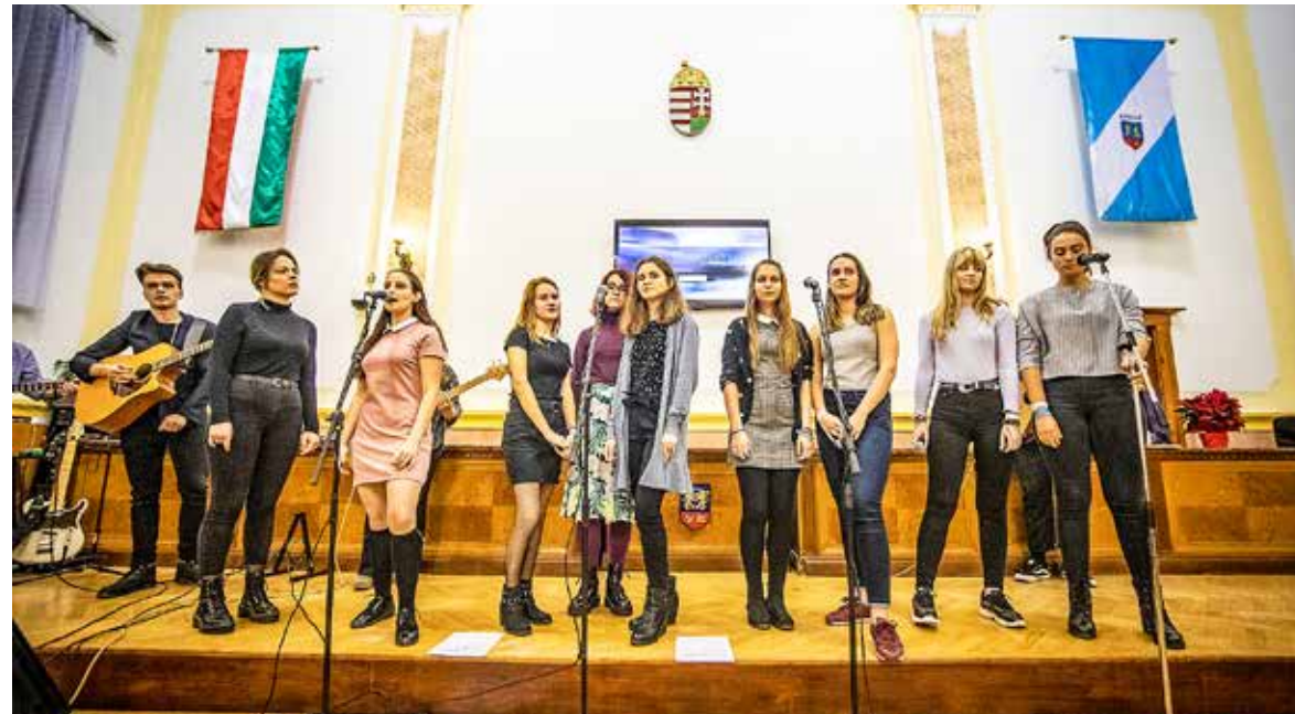
A zenét a Csillag Kórus és Zenekara szolgáltatta

Jótekonysági koncertet szervezett a Kispesti Rászorultak Megsegítésére Közalapítvány a Városháza dísztermében. Az est bevételét az alapítvány ötszázezer forintra kiegészítette, és egy kétéves, szívtranszplantációs műtét előtt álló kispesti kisfiúnak adta.