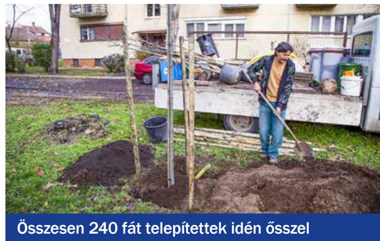
Összesen 240 fát telepítettek idén ősszel

hús fát ültettek a Kertvárosban, döntően a közösségi költségvetés terhére, míg a kerület egyéb pontjain, hét helyszínen 37 facsemetét telepítettek az év közben felmerült lakossági és egyéb igények alapján. Hat kerületi helyszínen 26 fa telepítését civil kezdeményezésre végezték a szakemberek. További 57 fiatal fát építkezések miatt kivágott fák pótlásaként, a Zöldprogram Iroda által kijelölt területeken az építetők ültettek el.