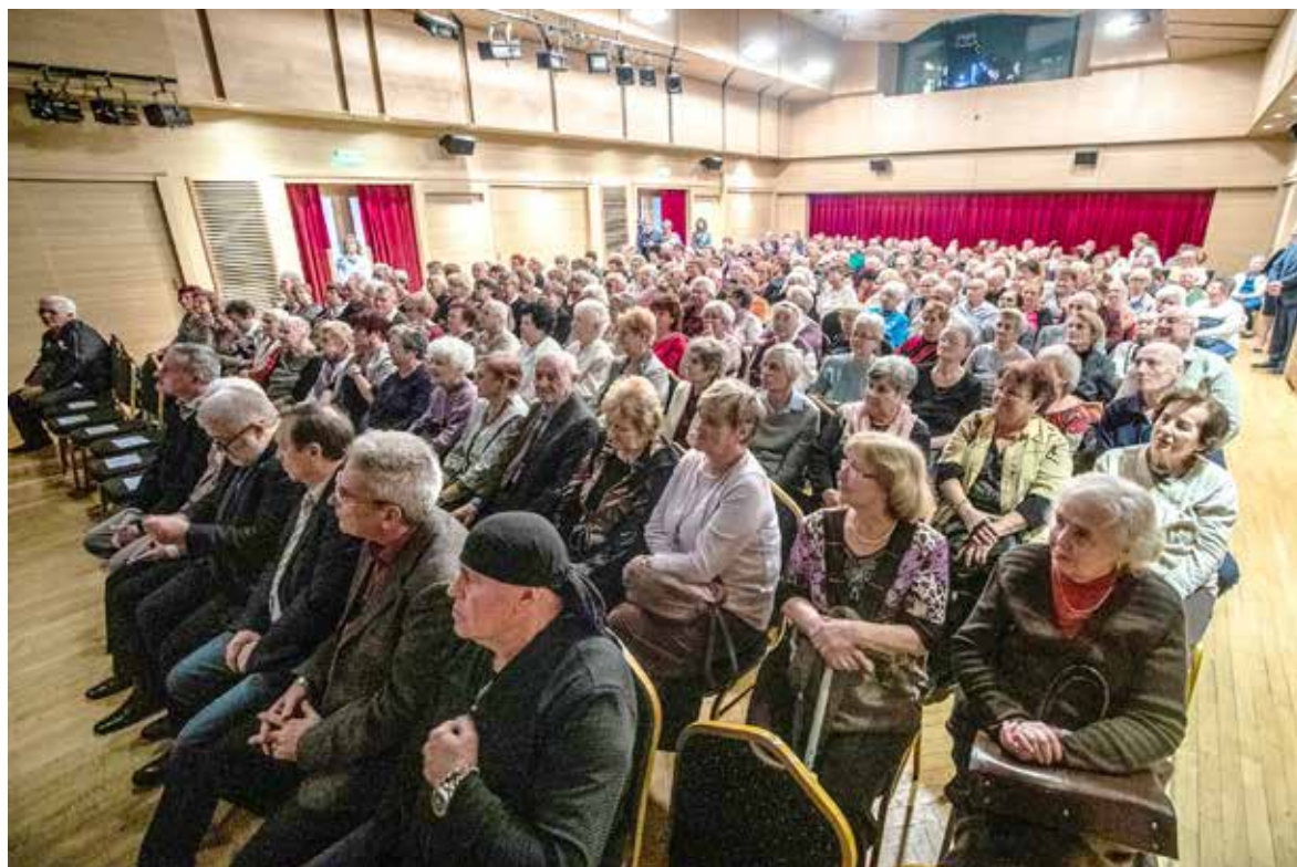
Kispesti időseknek rendeztek ünnepséget

Tizenegyedik alkalommal látta vendégül Kispest Önkormányzata és a Segítő Kéz Kispesti Gondozó Szolgálat karácsonyi ünnepségen a szolgálat gondozottjait és az őket segítő civilszervezeteket.