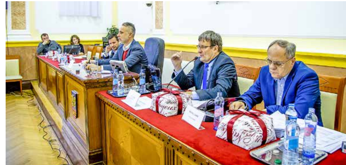
Fejlesztésre fordíthatja a kerület a többletbevételeket

Többek között Lackner Csaba bizottsági tagságának megszüntetéséről, telek- és építményadó-emelésről, valamint a Kerületi Építési Szabályzatról döntöttek a képviselők az idei év utolsó testületi ülésén.