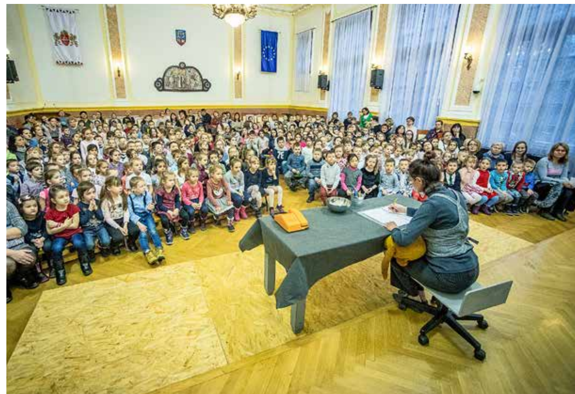
Bábelőadással örveztették meg a kicsiket

Bábelőadással ajándékozott meg az önkormányzat 270 nagycsoportos óvodást és alsós kisiskolást. A gyerekeket az óvónők és a tanítók választották ki az ünnepi eseményre.