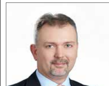
LAZÁNYI FERENC Listás képviselő (Fidesz-KDNP)