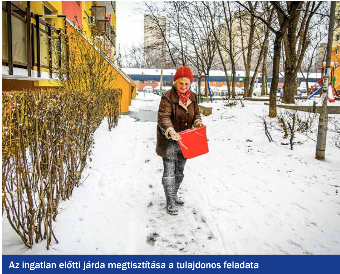
Az ingatlan előtti járda megtisztítása a tulajdonos feladata

Beköszöntött a téli időszak, szépségeivel, örömeivel és nehézségeivel együtt. Bár az idén még jelentősebb hómennyiség nem jelentkezett, a tél tartogathat számunkra további meglepetéseket, havat, ónos esőt, jegesedést, ezáltal csúszós járdákat és úttestet.