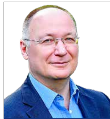
Burány Sándor (MSZP)

A közvéleményt időről időre felhőborítja egy-egy zaklatási ügy. Teljes joggal. Az ismertté váló esetekben rendre hatalommal rendelkező férfiak éltek vissza a helyzetükkel, az áldozatok szinte kivétel nélkül nők voltak, elmondható, hogy a traumát gyakran hosszú évek alatt sem lehet feldolgozni. A Fidesz rendre próbálta elbagatellizálni ezeket az ügyeket. Mint már oly sokszor, itt is Kósa Lajos nyilatkozott a legutóbbi és leghülyébb módon, mikor kijelentette, hogy egy honvéd középiskolában történt erőszakos anélis bánalmazás nem volt zaklatás. Az elmúlt napokban viszont a fideszesek meglehetősen gyomorforgató módon változtattak taktikát, és azonnal zaklatószínházat kezdtek emlegetni, amikor fény derült