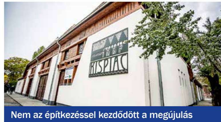
Nem az építkezéssel kezdődött a megújulás

énekkórusok és gólyalások, a biodobozosok, a paradicsompalánta-örökbefogadók, a kisüzemi kolbászosok és sajtosok, a házi pékárusok és sokan mások együtt töltötték és töltik meg ezután is színekkel, illatokkal, jó érzésekkel és gondolatokkal ezt a teret. Az önkormányzat vezetői rá is érezték a civilekkel való partneri viszony hasznára. A pályázatírástól kezdve a közösségi tervezési folyamat segítségével egészen a befejezésig és azon túl is a fejlődés motorjai a helyben élő, aktív állampolgárok voltak és lesznek. A kispia újjaépítése ezzel együtt a kispeszt fejlesztések és társadalmi egyeztetések állatorvosi lova.