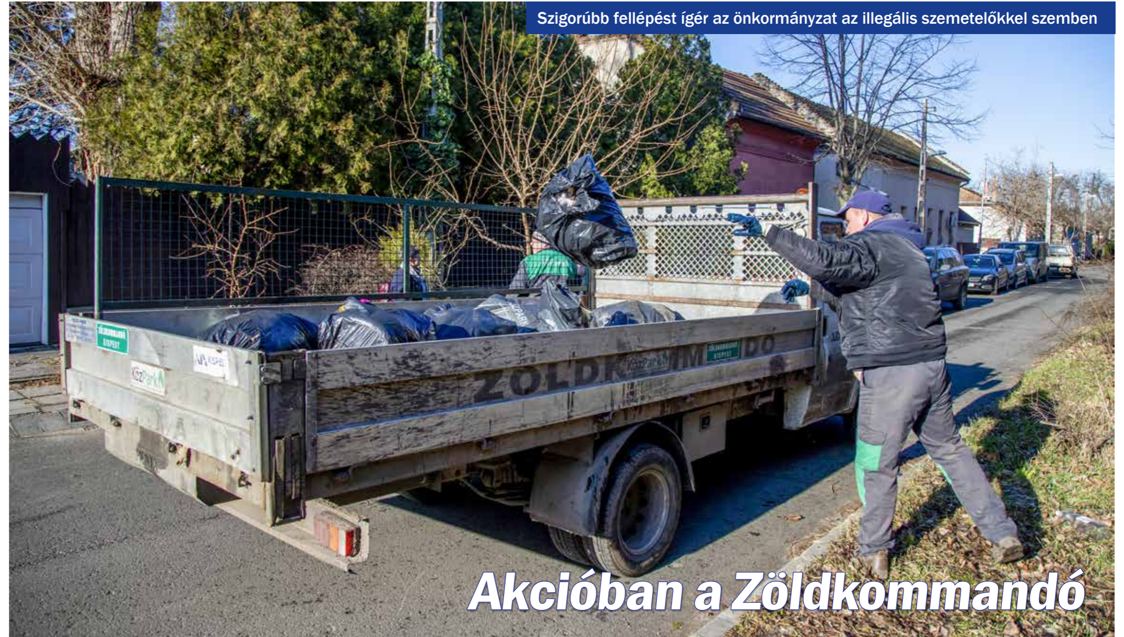
Szigorúbb fellépést ígér az önkormányzat az illegális szemétkukákkal szemben