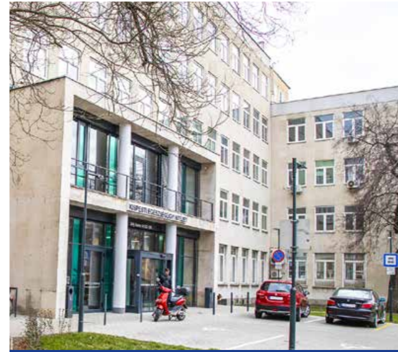
Kezdődhet a szakrendelő struktúraátalakítása

Az Egészséges Budapest Program keretében idén 931 millió forintot kap a kerület a Kispesti Egészségügyi Intézet további fejlesztésére.