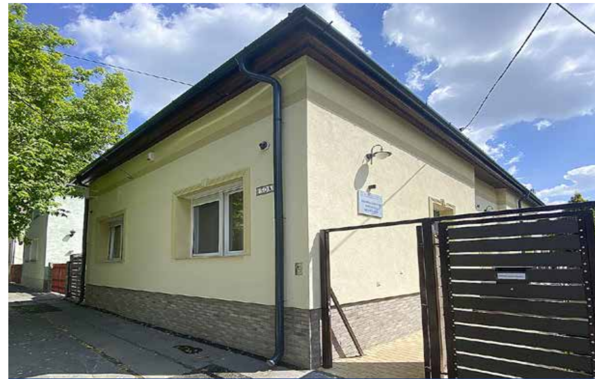
Modern rendelőt alakítottak ki a Fő utcában

A 21. század igényeinek megfelelő épületbe költözött át az 1989 óta Kiszpesten működő Yamamoto Intézet, amelynek diagnosztikai és gyógyító módszereiben egyedülálló módon ötvöződnek a hagyományos és a komplex orvoslás – természetes gyógymódok és gyógyszerek – eljárásai.