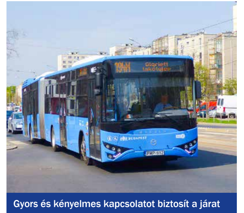
Gyors és kényelmes kapcsolatot biztosít a járat

a járat menetidejében, mivel a szállítási kapacitás is biztosított, nem jelentkezne zsúfoltság, így nem romlana a szolgáltatás minősége” – olvasható a közösen megfogalmazott levélben.