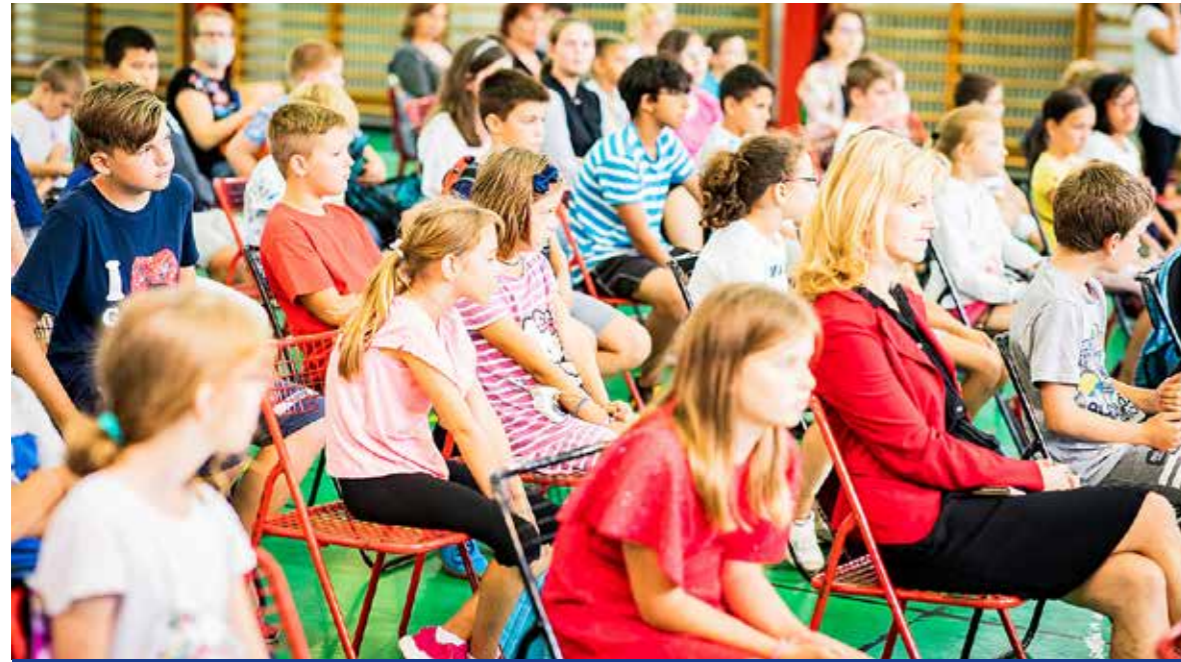
Bezárták a tábort a Kispesti Kóficok

Véget ért az idei Kispesti Kóficok Kerületi Napközis Tábor. A június 29-től augusztus 19-ig szervezett, térítésmentes napközis táborban hetente általában 100-120 kispesti gyerek tölthette tartalmasan a szünidőt. A szervezésre a tavalyi 10 millió forint helyett idén csaknem 15 millió forintot különített el az önkormányzat, így megemelt tiszteletdíjat kaphattak munkájukért az itt dolgozók.