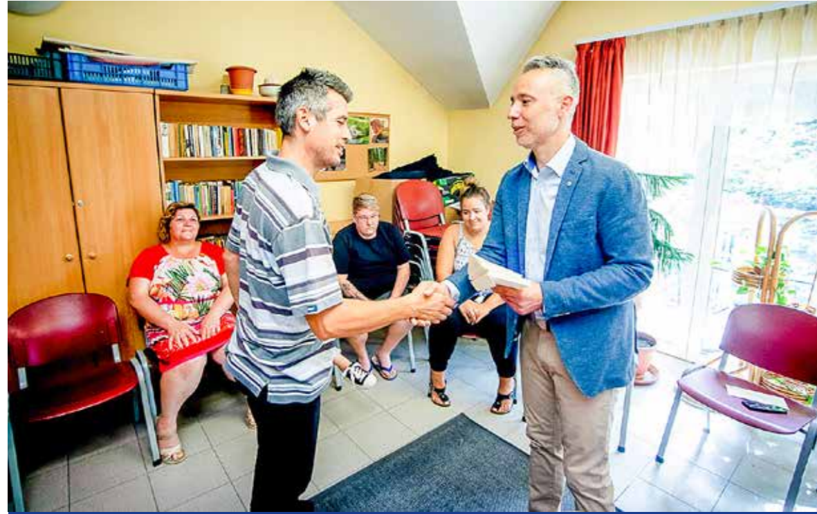
Gajda Péter polgármester adta át a jutalmakat

Jutalommal köszönte meg az önkormányzat vezetése az idősgondozásban és a szociális területen végzett odaadó munkát a koronavírus okozta veszélyhelyzet alatt. A Segítő Kéz Kispesti Gondozó Szolgálat és a Kispesti Szociális Szolgáltató Centrum munkatársainak Gajda Péter polgármester, valamint két alpolgármester, Vinczek György és Kertész Csaba vitte el a köszönőleveleket.