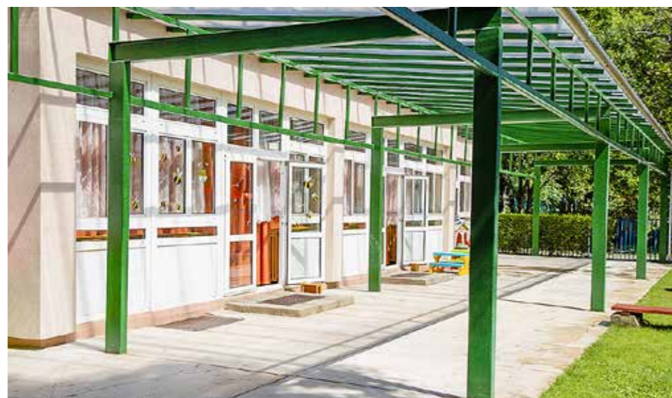
Kívülről is megszépült az Eszterlánc bölcsőde

30 millió forintjába kerül az önkormányzatnak ez a program. A 12,5 millió forint összértékben megrendelt új játékok zömét várhatóan a következő hetekben kiszállítják az intézményekbe, néhány azonban csak október elején érkezik. Összesen 108 eszközt javítanak, újítanak fel a VAMŰSZ és a Közpark Kft. dolgozói folyamatos szakértői ellenőrzés mellett. A munkák befejezését követően, a használatba vételt megelőzően valamennyi eszköz minősítése megtörténik. A 2020/2021-es nevelési évben 397 kisgyerek kezd majd óvodába járni Kispesten, és 1497 fős létszámmal, összesen 73 csoporttal indulnak az intézmények. A 12 kerületi óvoda alapító okiratában meghatározott létszám összesen 1966 fő, így a kispesti intézmények ki tudják szolgálni a lakossági igényeket.