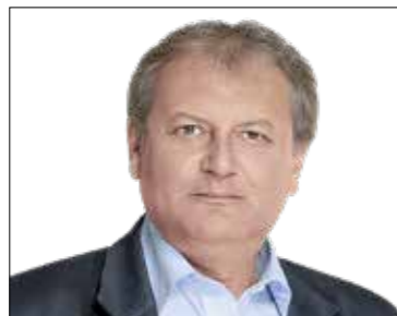
DR. HILLER ISTVÁN országgyűlési képviselő (MSZP)