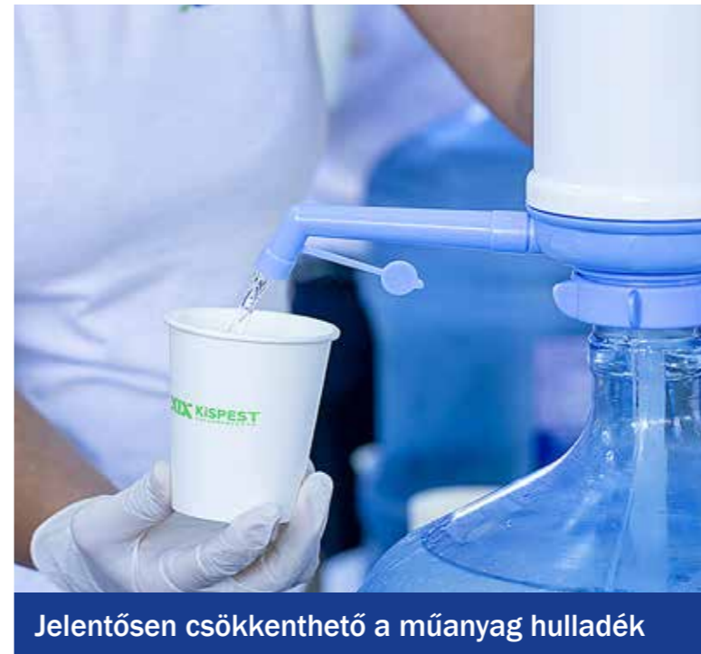
Jelentősen csökkenthető a műanyag hulladék