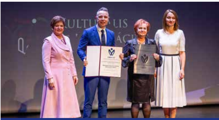
Újabb öt évre szól a minősítés

A Kulturális és Innovációs Minisztérium, a magyar kultúra napja (január 22.) al-