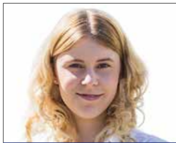
SZILAS KINCŐ 8. sz. választókerület (MSZP-DK-Momentum-Párbeszéd-LMP)

Előzetes telefonos egyeztetés alapján (06-30-270-0012) minden hónap második csütörtökén 17 és 18 óra között