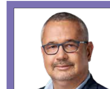
ARATÓ GERGELY országgyűlési képviselő (DK)

Egyéni bejelentkezés alapján a gergely.arato.kepviselo@gmail.com e-mail-címen vagy a 06-30-407-6369-es telefonszámon