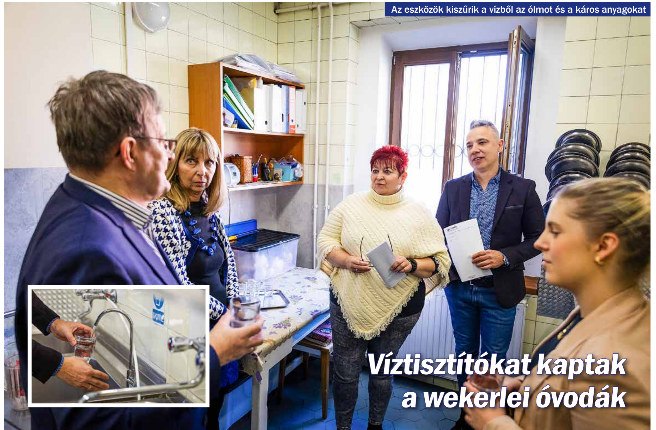
Az eszközök kiszűrik a vízből az ólmot és a káros anyagokat

A bizottság különdíját kapta a KEÓ Mézeskalács Kelet utcai Művészeti Tagóvodája. Polgármesteri különdíjban részesült az Első Kis-Pesti Kert Civil Társaság.