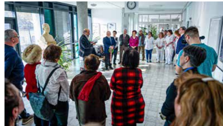
Megemlékezés a szakrendelőben

Az önkormányzat, a Kispesti Egészségügyi Intézet, a Magyar Ellenállók és Antifasiszták Szövetsége (MEASZ) kispesti csoportjának, valamint a Romák Felzárkóztatásáért Egyesület (Romfel) közreműködésével tartottak megemlékezést Jahn Ferenc mellszobrá előtt, a szakrendelőben február elején.