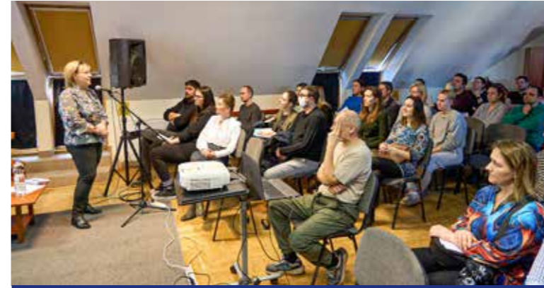
Hagyományos program a Bölcsődenyitogató

Tizedik alkalommal rendezték meg a Bölcsődenyitogatót a Wekerlei Kultúrházban február elején. A rendezvényen a kispesti bölcsődék vezetői bemutatták intézményüket az érdeklődő szülőknek.