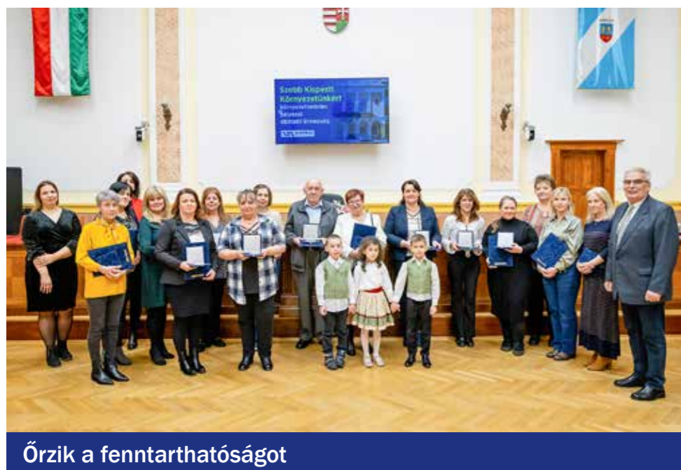
Őrzik a fenntarthatóságot