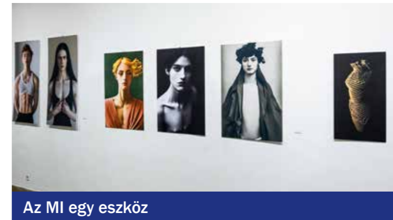
Az MI egy eszköz

Az MI egy eszköz, nem csinál az ember helyett művészetet. Ha egy művész ezt használja, akkor van helye a művészetben, ha pedig nem, akkor nincs