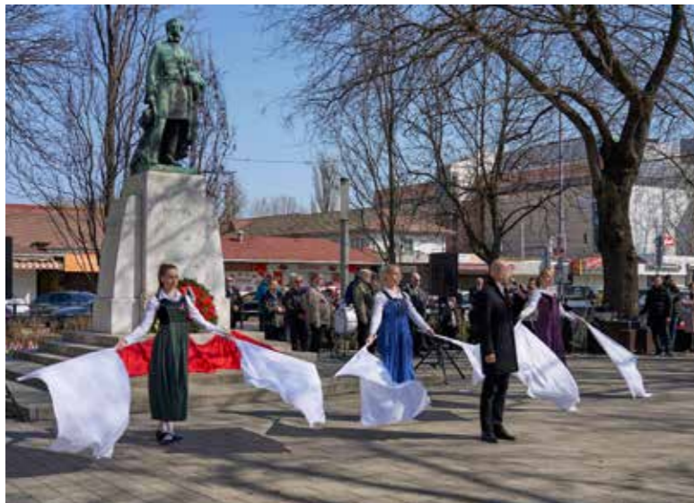
Részlet a műorból

Hagyományosan az 1911-ben állított Kossuth-szobor előtt tartotta március 15-i ünnepségét Kispest Önkormányzata. A programban a KMO Obsitos Zenekarának kamarazenekara működött közre.