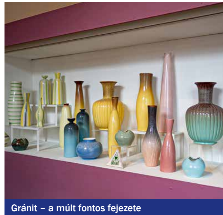
Gránit – a múlt fontos fejezete