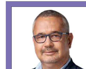
ARATÓ GERGELY országgyűlési képviselő (DK)