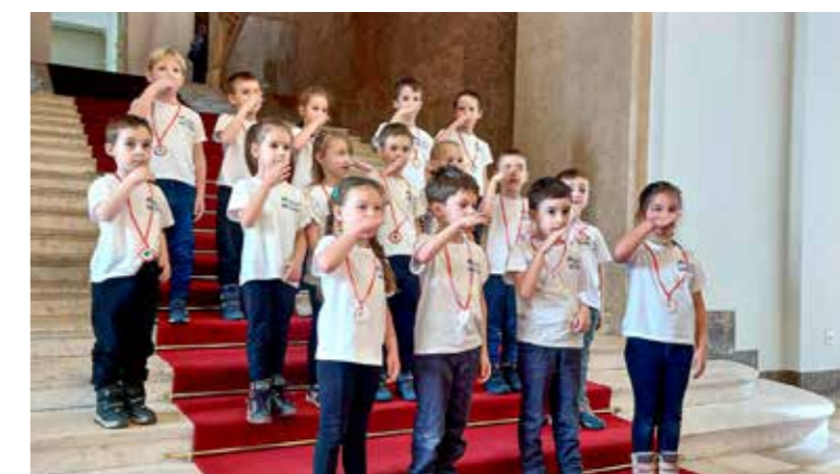
Hangolódtak az ünnepre

Ez az együttműködés azért is kuriózum, mert korábban elsősorban az idősebb korosztályoknak, általános és középiskolásoknak voltak foglalkozások a múzeumban, a kispeszt óvodások voltak az elsők a kicsiknek szervezett csoportok között – hangsúlyozta. A múzeum és az önkormányzat együttműködésének gondolata