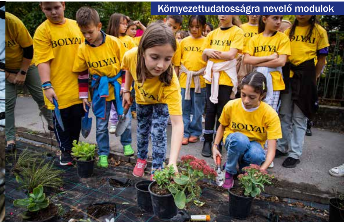
Környezettudatosságra nevelő modulok