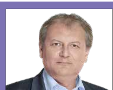
DR. HILLER ISTVÁN országgyűlési képviselő (MSZP)